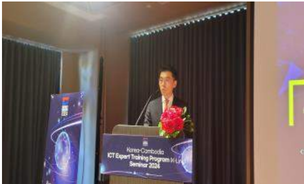
(조목은 수석 발표)