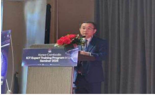
(캄보디아 Kong Phallack 차관 발표)